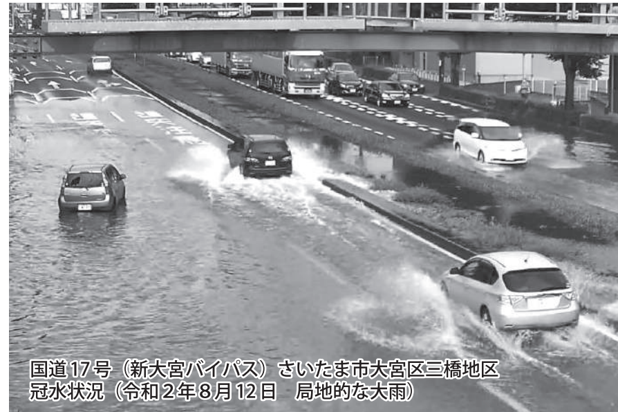
国道17号(新大宮バイパス)さいたま市大宮区三橋地区 冠水状況(令和2年8月12日 局地的な大雨)