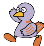
埼玉県のマスコット 「コバトン」

お問合せ 埼玉新聞社クロスメディア局内 「働き方改革実践講座」事務局 TEL.048-795-9932 FAX.048-662-6610