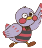
埼玉県のマスコット 「さいたまっち」

申込方法 裏面をご覧の上、 FAX または埼玉新聞ホームページの 応募フォームからお申し込みください。