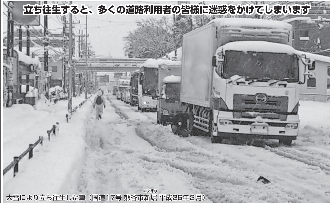
にいほり 大雪により立ち往生した車（国道17号 熊谷市新堀 平成26年2月）

■ 普段雪の少ない平野部でも大雪になることがあります。車を運転する際は、最新の気象情報の確認をお願いします。